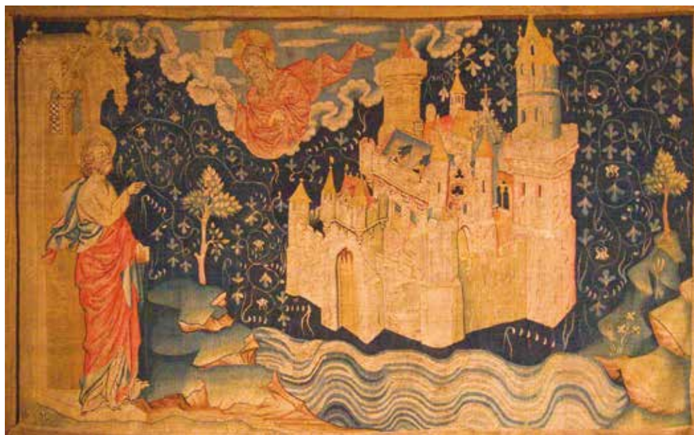
« La Jérusalem céleste », détail de la tapisserie d'Angers, (XIV e siècle)

Depuis quelques années, nous vous proposons dans les pages du VEAB, des introductions aux livres bibliques.